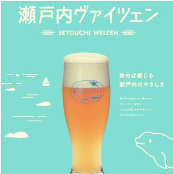
瀬戸内ヴァイツェン