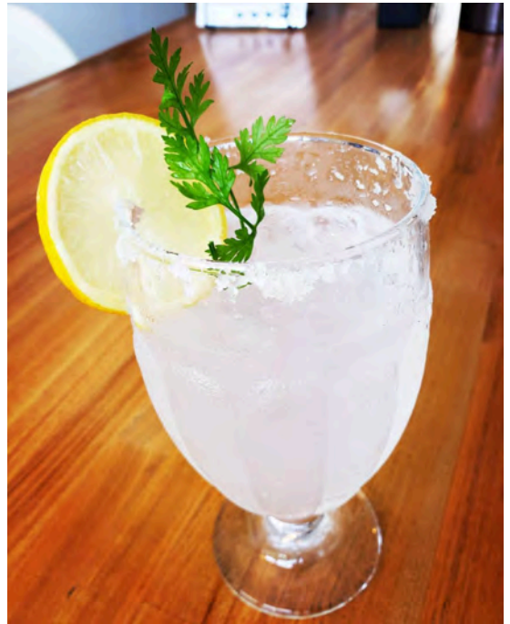
家島 塩レモンサワー