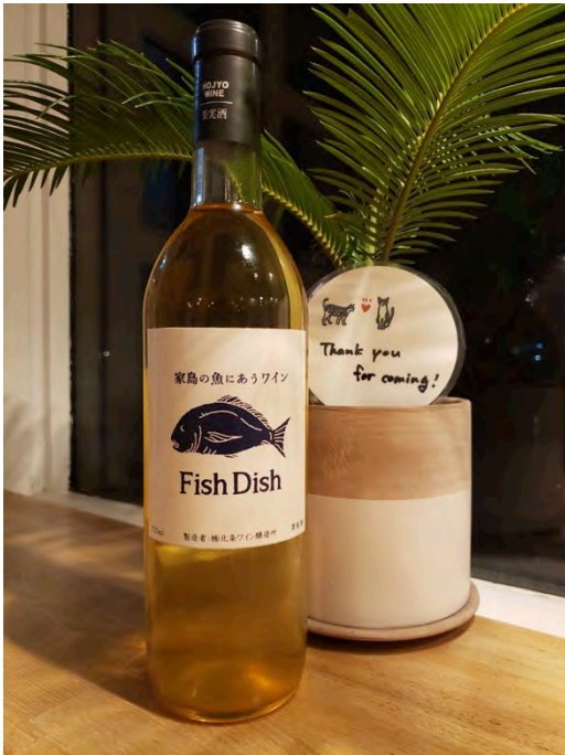
魚にあうワイン (グラス売りもあります!)