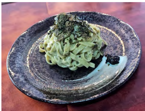
海苔のクリームパスタ