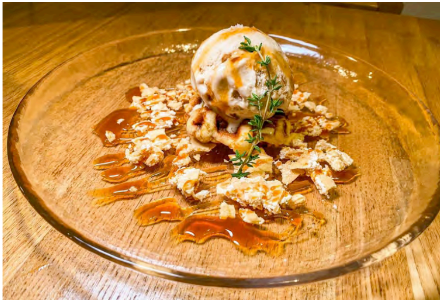
家島塩キャラメルナッツアイス