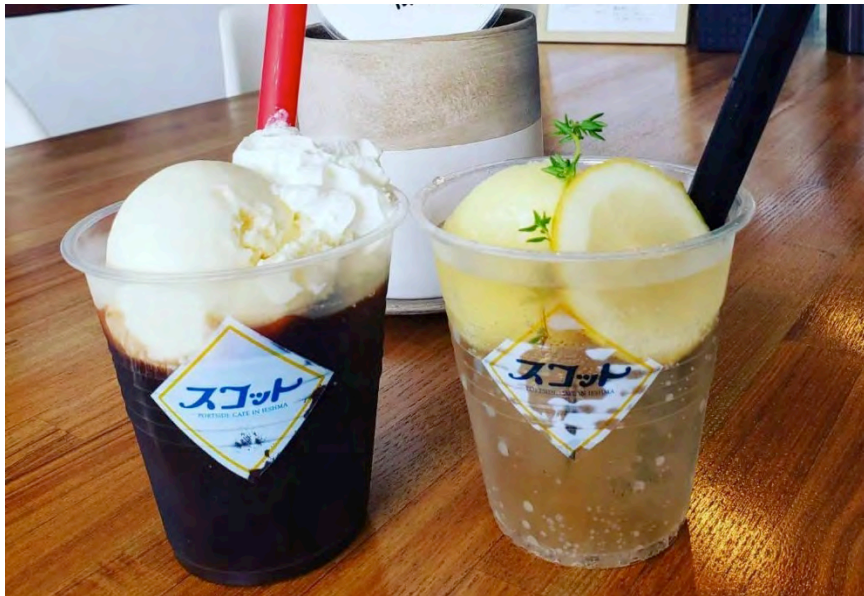
Scott のコーヒーフロート 超すっばい！家島塩レモネード