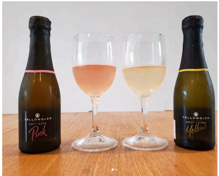
スパークリングワイン ピンク・イエロー