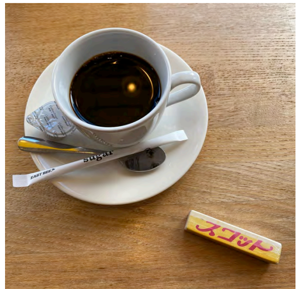
店内挽きドリップコーヒー