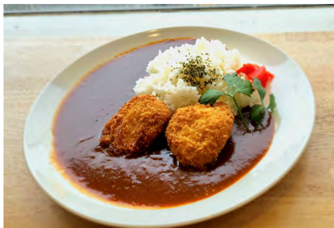
特製 デミ豚かつめし